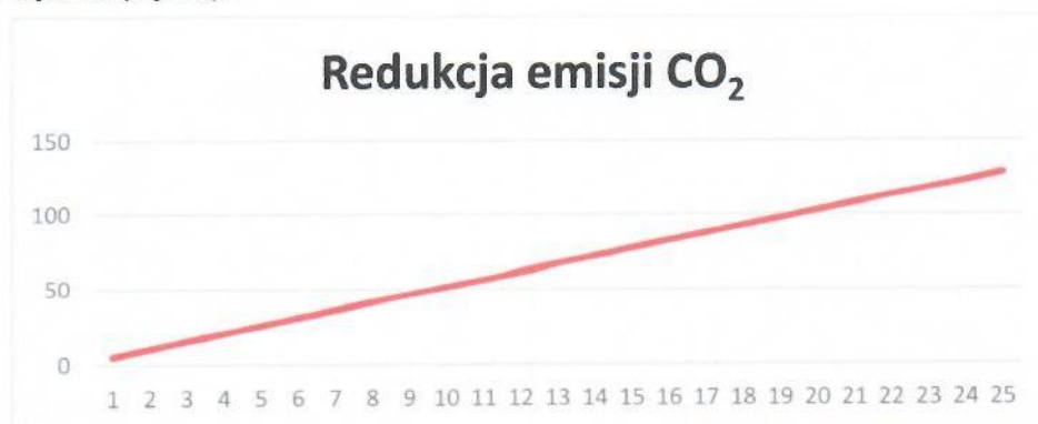
Rys. 3. Redukcja emisji CO 2

Instalacja grzewcza z wykorzystaniem kotła na paliwo gazowe ma znaczny wpływ na środowisko. Produkcja energii cieplnej z wykorzystaniem gazu ziemnego pozwala na redukcję emisji dwutlenku węgla, która miałaby miejsce w wypadku wytwarzania energii cieplnej w procesie spalania paliw kopalnych. Dla proponowanej instalacji wskaźnik ten pokazuje poniższy wykres (Rys.3).