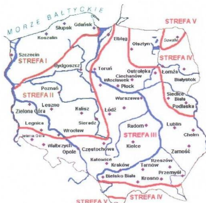
Rys. 1 Strefy klimatyczne Polski i temperatury obliczeniowe

Położenie obiektu, w którym planowany jest montaż, na mapie ma wpływ na pracę instalacji. W zależności od współrzędnych geograficznych rozbieżności w temperaturach projektowych mogą mieć znaczącą wartość. W skali kraju ilustruje to poniższa mapa (Rys.1).