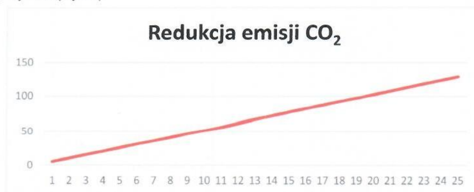
Rys. 3. Redukcja emisji CO 2

Instalacja grzewcza z wykorzystaniem kotła na paliwo gazowe ma znaczny wpływ na środowisko. Produkcja energii cieplnej z wykorzystaniem gazu ziemnego pozwala na redukcję emisji dwutlenku węgla, która miałaby miejsce w wypadku wytwarzania energii cieplnej w procesie spalania paliw kopalnych. Dla proponowanej instalacji wskaźnik ten pokazuje poniższy wykres (Rys.3).