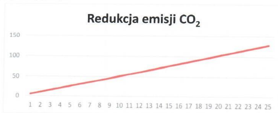
Rys. 3. Redukcja emisji CO 2

Instalacja grzewcza z wykorzystaniem kotła na paliwo gazowe ma znaczny wpływ na środowisko. Produkcja energii cieplnej z wykorzystaniem gazu ziemnego pozwala na redukcję emisji dwutlenku węgla, która miałaby miejsce w wypadku wytwarzania energii cieplnej w procesie spalania paliw kopalnych. Dla proponowanej instalacji wskaźnik ten pokazuje poniższy wykres (Rys.3).