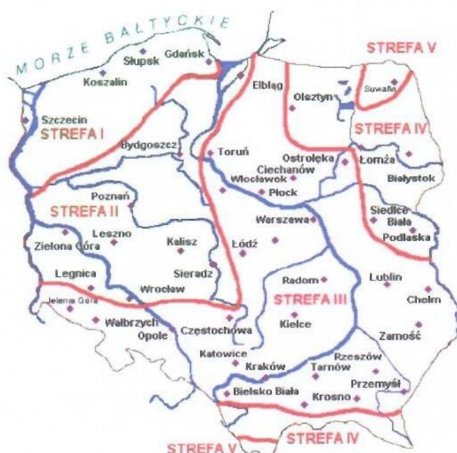
Rys. 1 Strefy klimatyczne Polski i temperatury obliczeniowe

Położenie obiektu, w którym planowany jest montaż, na mapie ma wpływ na pracę instalacji. W zależności od współrzędnych geograficznych rozbieżności w temperaturach projektowych mogą mieć znaczącą wartość. W skali kraju ilustruje to poniższa mapa (Rys.1).