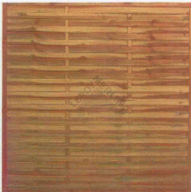
Przykładowy płotek drewniany – ogrodzenie placu zabaw.

Ad 5. Przykładowe ogrodzenie z plecionki drewnianej