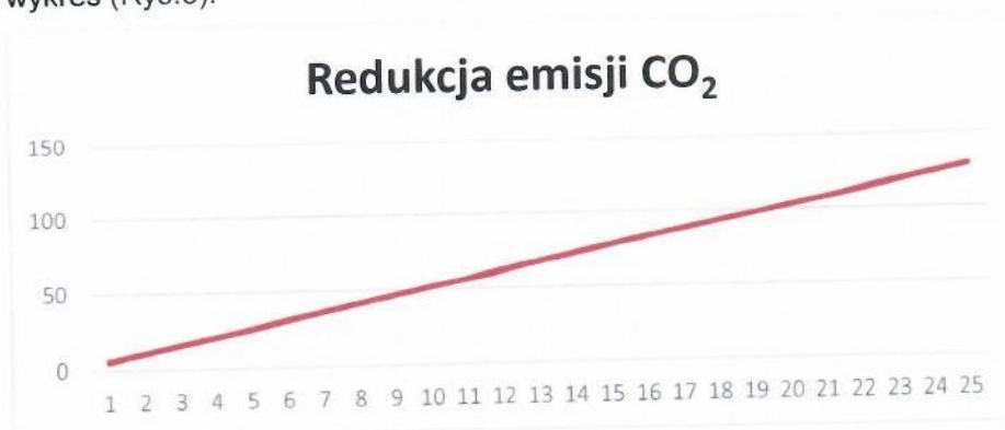
Rys. 3. Redukcja emisji CO 2

Instalacja grzewcza z wykorzystaniem kotła na paliwo gazowe ma znaczny wpływ na środowisko. Produkcja energii cieplnej z wykorzystaniem gazu ziemnego pozwala na redukcję emisji dwutlenku węgla, która miałaby miejsce w wypadku wytwarzania energii cieplnej w procesie spalania paliw kopalnych. Dla proponowanej instalacji wskaźnik ten pokazuje poniższy wykres (Rys.3).