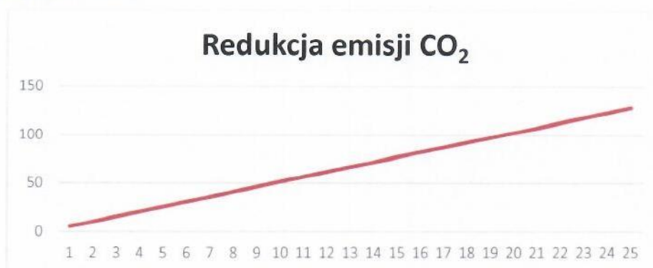
Rys. 3. Redukcja emisji CO 2

Instalacja grzewcza z wykorzystaniem kotła na paliwo gazowe ma znaczny wpływ na środowisko. Produkcja energii cieplnej z wykorzystaniem gazu ziemnego pozwala na redukcję emisji dwutlenku węgla, która miałaby miejsce w wypadku wytwarzania energii cieplnej w procesie spalania paliw kopalnych. Dla proponowanej instalacji wskaźnik ten pokazuje poniższy wykres (Rys.3).