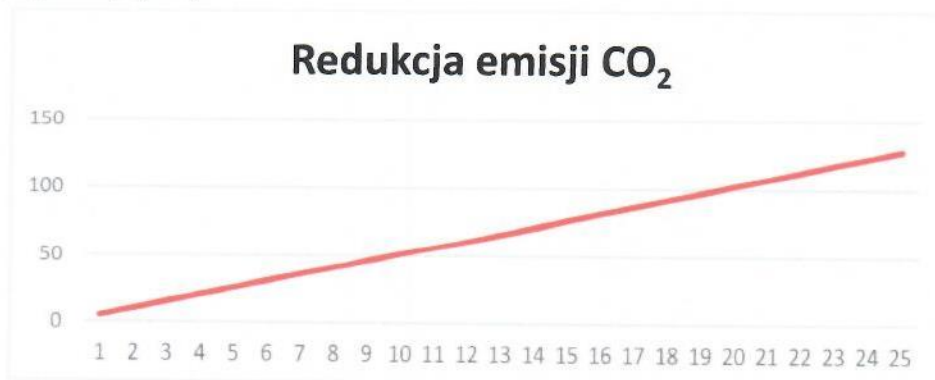
Rys. 3. Redukcja emisji CO 2

Instalacja grzewcza z wykorzystaniem kotła na paliwo gazowe ma znaczny wpływ na środowisko. Produkcja energii cieplnej z wykorzystaniem gazu ziemnego pozwala na redukcję emisji dwutlenku węgla, która miałaby miejsce w wypadku wytwarzania energii cieplnej w procesie spalania paliw kopalnych. Dla proponowanej instalacji wskaźnik ten pokazuje poniższy wykres (Rys.3).